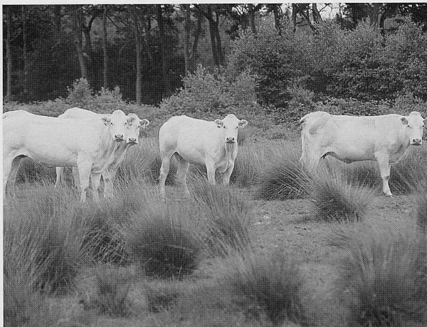
Tussen 1995 en 2003 zijn ongeveer zestig nieuwe terreinen in begrazingsbeheer genomen. Ook is het oppervlak van de al langer begraasde terreinen uitgebreid.

De enquête maakt ook duidelijk dat beheerders een aanzienlijke variatie in graasdruk hanteren. Dit heeft vooral te maken met verschillen in vegetatiesamenstelling, waaronder de verhouding grasland/struweel/bos, maar ook met de variatie in bodem- en groeiplaatscondities. Ook speelt het aantal jaren van begrazing een rol. Bij introductie van grazers in een terrein wordt vaak tijdelijk een hoge graasdruk aangelegd om de verruiging terug te dringen. Na ver-